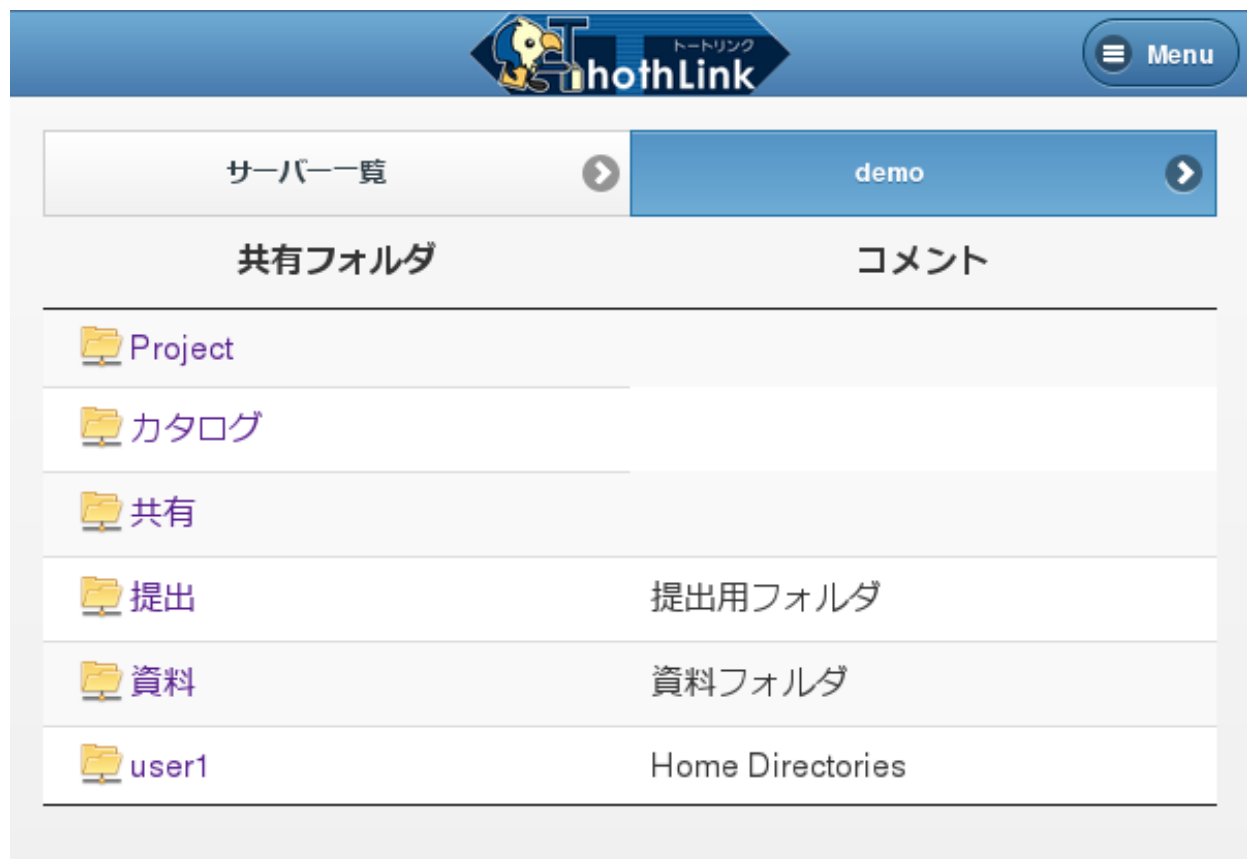
図2 共有フォルダ一覧画面