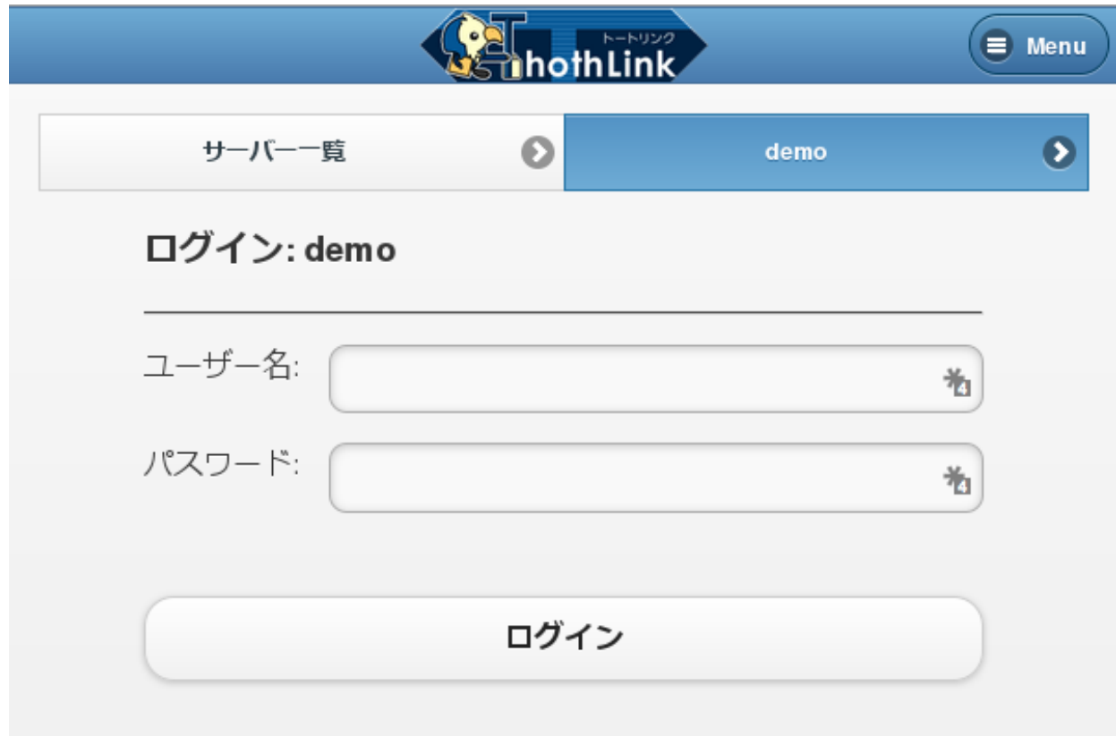
図 1 ログイン画面