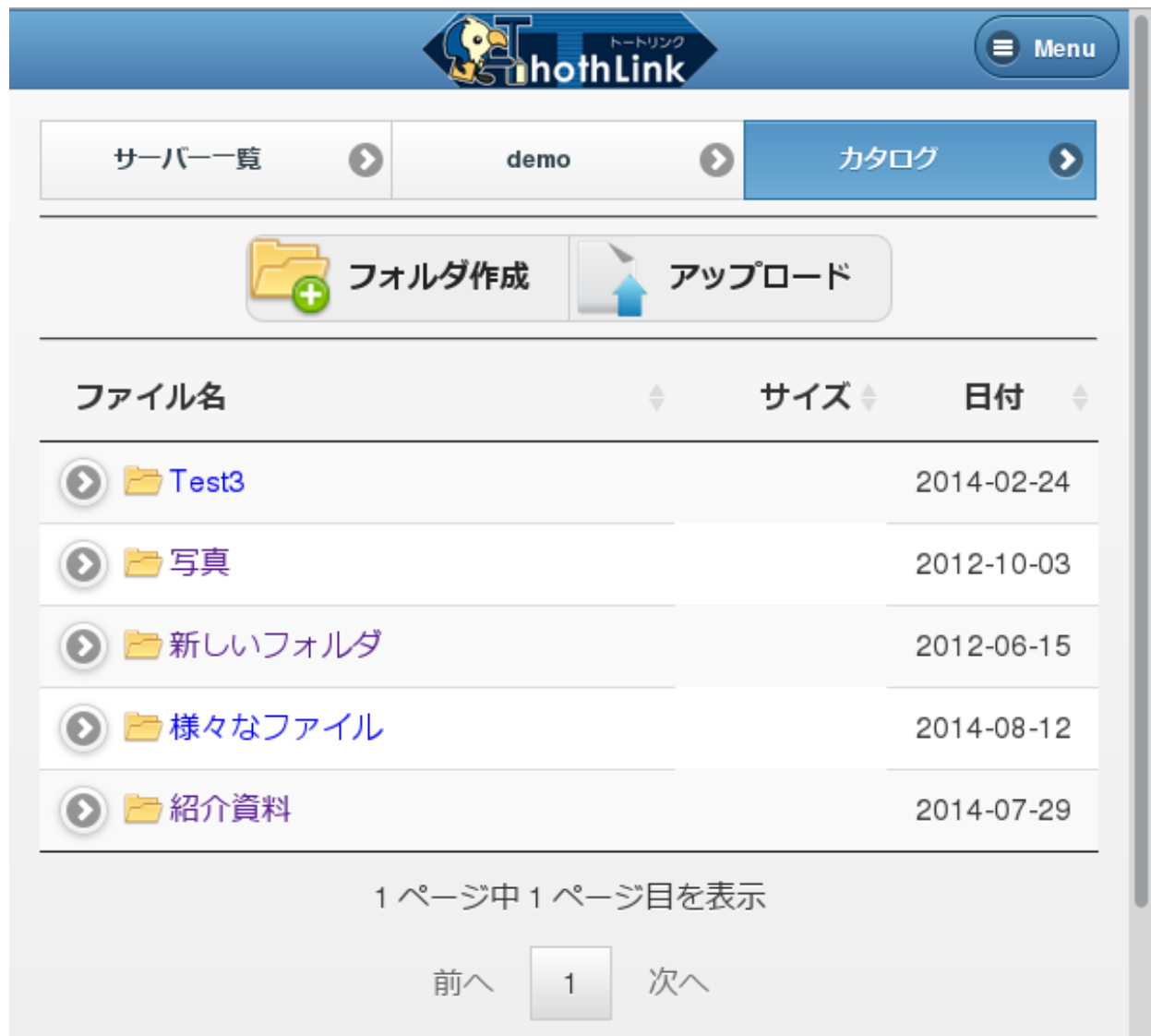
図3 ファイル一覧画面